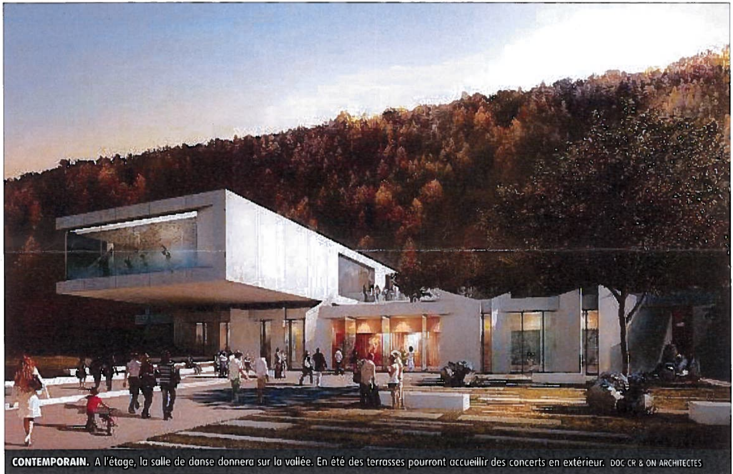
CONTEMPORAIN. A l'étage, la salle de danse donnera sur la vallée. En été des terrasses pourront accueillir des concerts en extérieur.